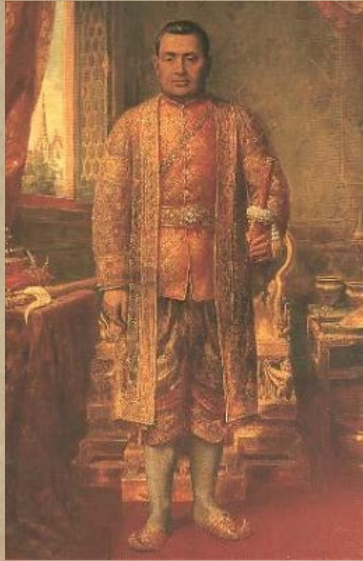
พระบาทสมเด็จพระนั่งเกล้าเจ้าอยู่หัว